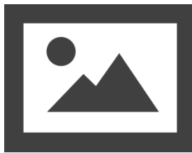
Figure 2. Icône d'image 1

L'auteur s'engage à s'assurer de pouvoir publier les reproductions qu'il soumet.